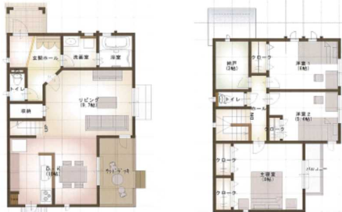
● 1階平面図 ● 2階平面図